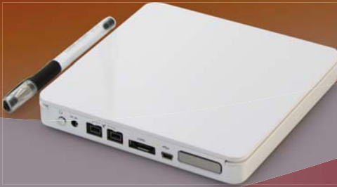
RS-S2TJ USB 2.0/eSATA/1394b