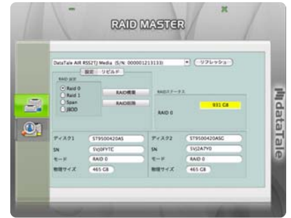
RAID MASTER Mac版

ユーザーフレンドリーな設計のRAID MASTERは簡単にRAIDの設定ができ、ディスクの状態も一目瞭然。2つのハードディスクで構成できるRAIDモード、JBOD(None RAID)、RAID 0(ストライピング)、RAID 1(ミラーリング)、スパニング(ラージ)に対応、ユーザーのニーズに応えます。