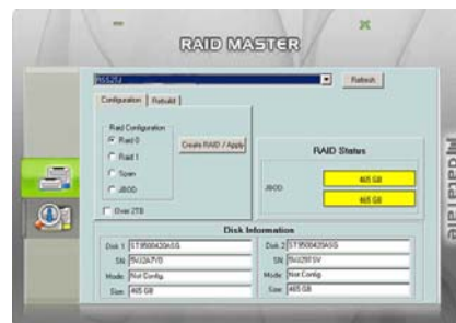
使用圖形介面操作RAID

可設定JBOD (Non RAID), RAID 0 (Striping), RAID 1 (Mirroring), 以及Span.