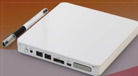
RS-S2TJ USB 2.0/eSATA/1394b