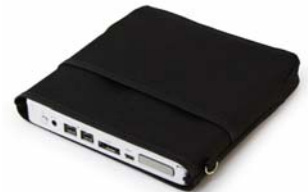
附赠时尚黑色保护套, 方便携带