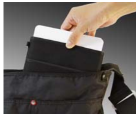
外型轻巧, 造型简洁光滑